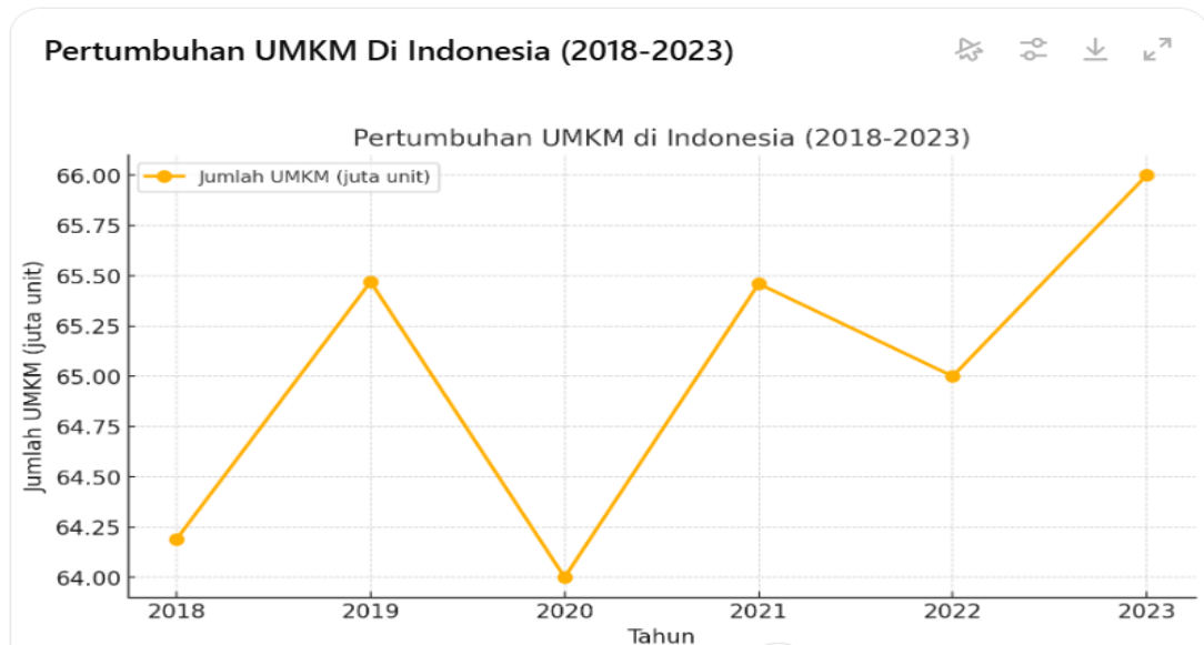
Rajah 1.1: Pertumbuhan Perniagaan Kecil dan Sederhana di Indonesia 2018-2023

Sumber: Kamar Dagang dan Industri Indonesia (KADIN)